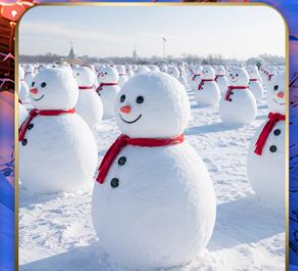
สวนตุ๊กตาหิมะ