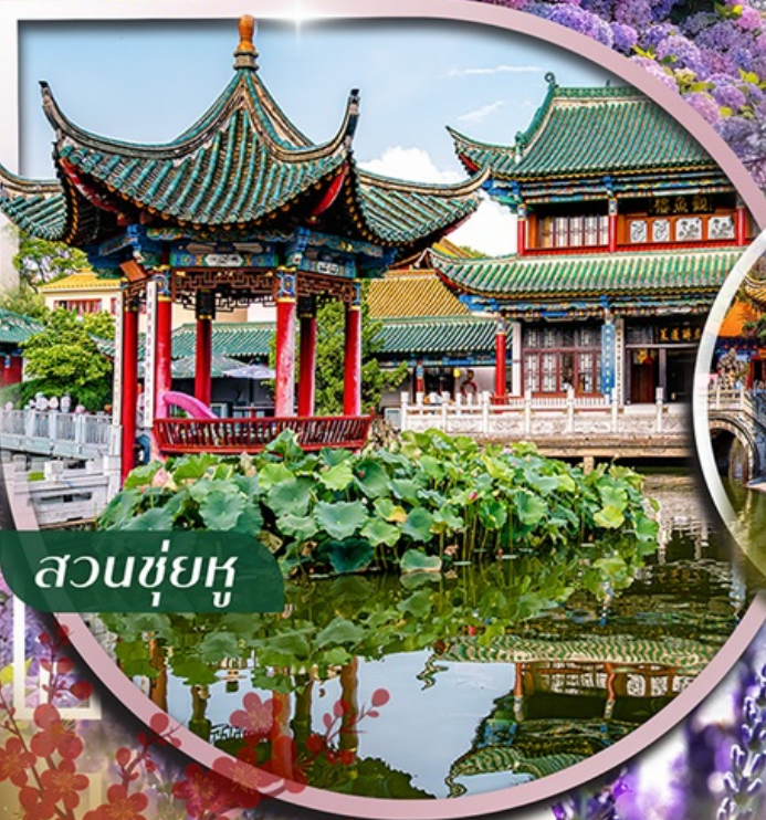
สวนชู่หู