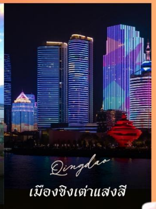
Qingdao เมืองชิงเต่าแสงสี