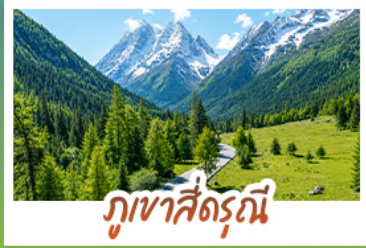
ภูเขาสี่ตุรณี