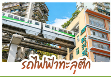
รถไฟฟ้าทะลุคด

ชมธรรมชาติ ณ อู่หลง ชมหุบเขาสุดอลังการระดับมรดกโลก นั่งรถไฟฟ้าทะลุคดหาลี้จ้อป้า สัญลักษณ์เมืองจงชิ่งสุดล้ำ สัมผัสวิถีภูเขาหิมะแห่ง ภูเขาสี่ตุรณี งดงามจนได้รับฉายา “เทือกเขาแอลป์แห่งตะวันออก” ชมธรรมชาติสุดฟิน ณ อุทยานป่าเผิงโกว • ซ้อป๋อโง่ใจ ถนนคนเดินไท่กู่หลี่, ถนนคนเดินซุนซี้ลู่