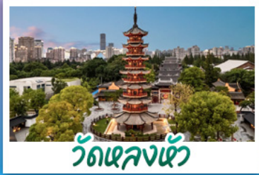
วัดหลงเซ้า