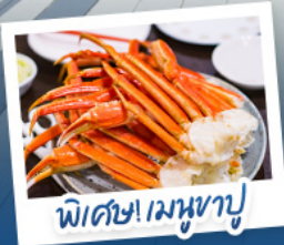
พิเศษ! เมฆหุซุ