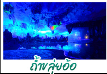
ถ้ำลัซ้อ