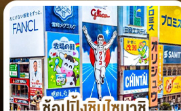
ช้อปปิ้งชินโซบาชิ และโดตงโมริ