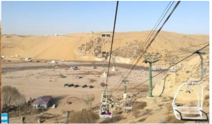
หมายเหตุ รายการทัวร์ไม่รวมค่ารถ 4x4