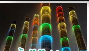
น้ำพุไม้ไผ่ตักSKP