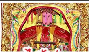
ไต้ตังมา

มรดกโลกบ้านดินถู่โหลวเตียนโหลวเคิง - สะพานเซียงจิว ไต้ตังมา (เจ้าแม่กบกับทิม) - เอียงบูชิว (เจ้าพ่อเสือ) พระเจ้าตากสินมหาราช - อวนน้ำแร่จากธรรมชาติ ไม่ลงร้านช้อปปิ้ง - พักโรงแรม 4 ดาว เมนูพิเศษ!!! อาหารแต้จิ๋ว 18 อย่าง, สุกี้ซีฟู้ด ผ่านพะไลต้นตำรับแต้จิ๋ว