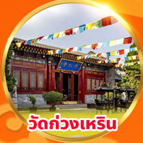
วัดก่วงเหริน