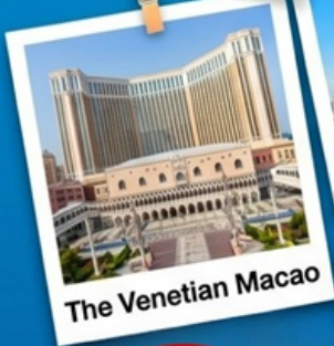
The Venetian Macao