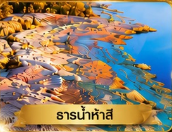
ธารน้ำห้ำสี