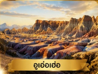
อุฮ้อเฮ่อ