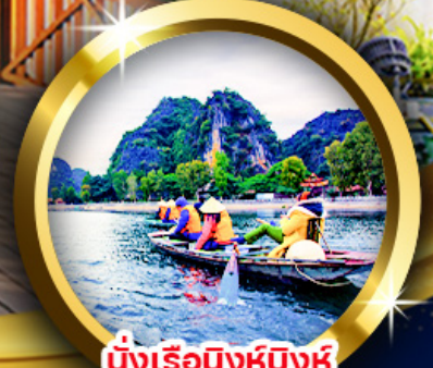
นั่งเรือดิงห์บิงห์