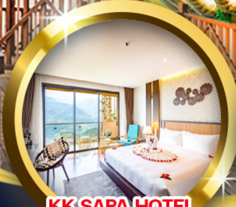
KK SAPA HOTEL วิวภูเขา 180 องศา