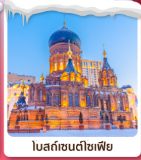
โบสถ์เซนต์คาทาลีน