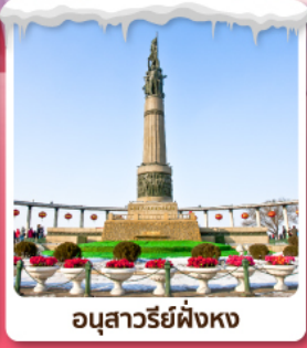
อนุสาวรีย์ฟ่งหง