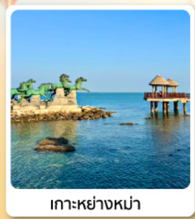
เกาะหย่างหม่า