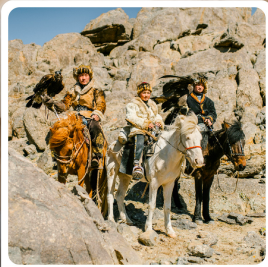
ชนเผ่ามองโก