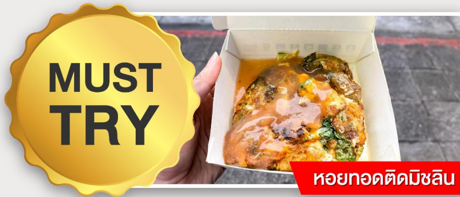
หอยทอดตัดมิชลิน

อิสระอาหารเย็นตามอัธยาศัย ณ ตลาดกลางคืนหนิงเซี่ย