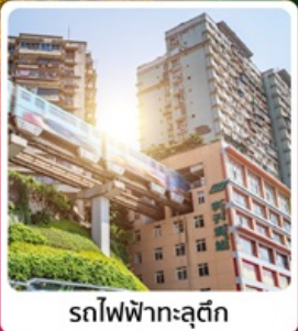
รถไฟฟ้ากระตุ๊ก