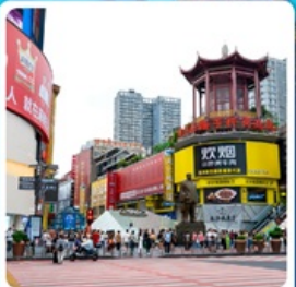
ถนนหวงซิงลู่