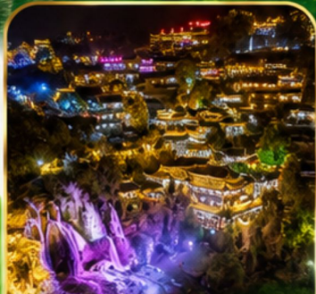
เมืองโบราณผู่หลงเจิน