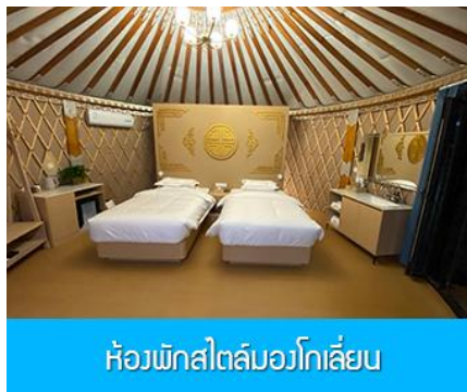
ห้องพักสไตล์มอว์โกเลีย