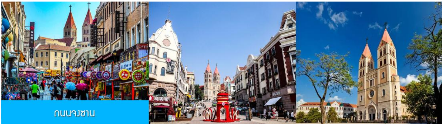
ถนนวาชาน