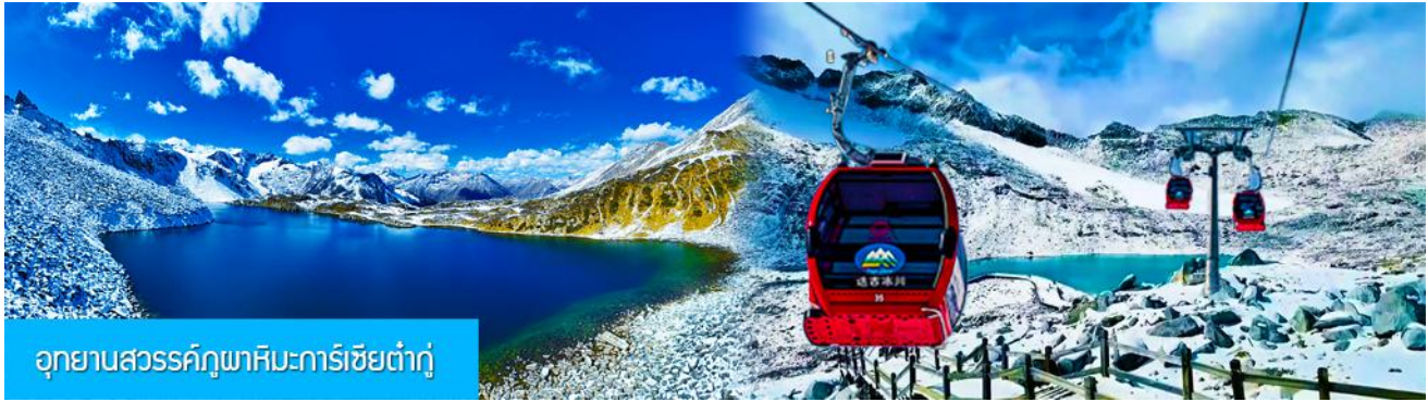
อุทยานสวรรค์ภูผาหิมะการ์เซียต้ากู๋