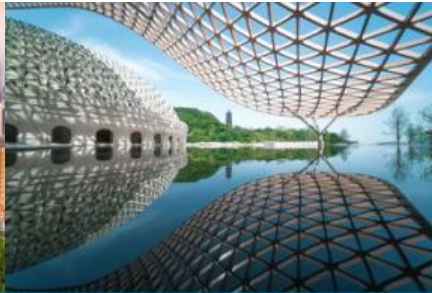
อุทยานก่อกมกั๊วหนิวโล้วซาน