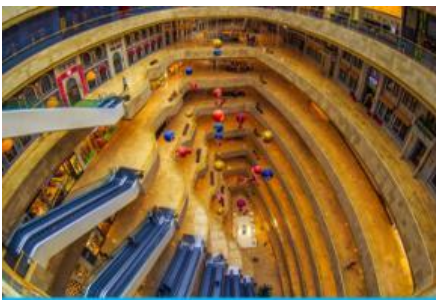
จัตุรัสเต๋อจี

พักที่ โรงแรม Holiday Inn Express Dongshan Hotel 4* หรือเทียบเท่าในนครหนานจิง