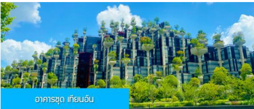
อาคารชุด เทียนอัน

เที่ยง รับประทานอาหารกลางวัน ณ ภัตตาคาร (6)