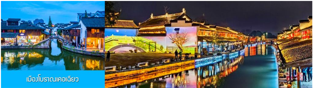
เมืองโบราณเคอเจียว