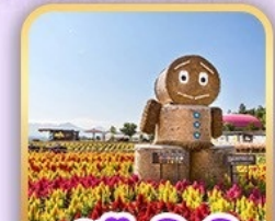
สวนซิกิไซโนะโอกะ