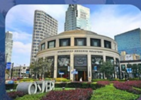
สตาร์บิคใหญ่ที่สุดในเอเชีย