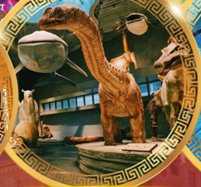
พิพิธภัณฑ์ธรรมชาติเซี่ยงไฮ้