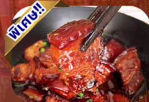
เมนูหมูสามชั้นตุ๋นน้ำแดง

พักโรงแรม 4 ดาว ★★★★★ ฟรี ประกันอุบัติเหตุ บริการ อาหารท้องถิ่น