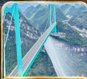
สะพานฮวาเกียง