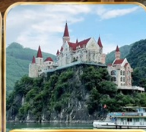
ล่องทะเลสาบวั้นเฟิงหู