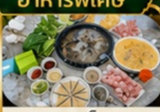
ชาปูเห็ด