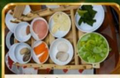
ขนมจีนข้ามสะพาน