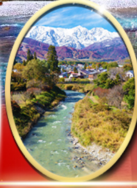
โออิเดะพาร์ค