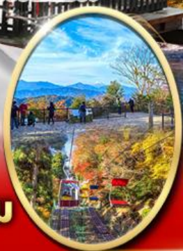
ภูเขา ทาคาโอะ

ปราสาทดสิโมโต้ Starbuck Snow Peak Land วัดชินโซจิ