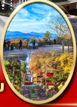
ภูเขา ทาคาโอะ