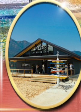
Ao Lakeside Cafe