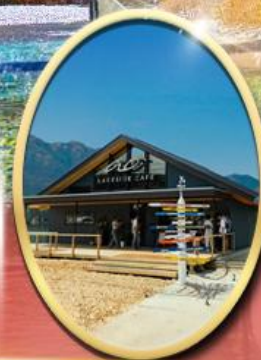
Ao Lakeside Cafe

34,919 ราคา เริ่มต้น บาท รวมภาษีมูลค่าเพิ่ม 7%