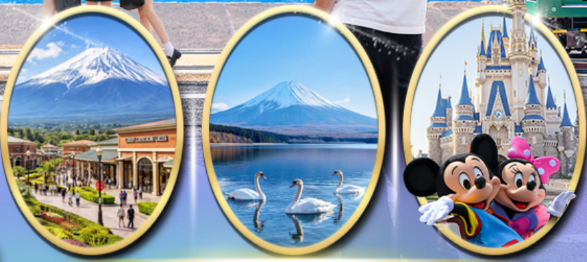
Gotemba Premium Outlets