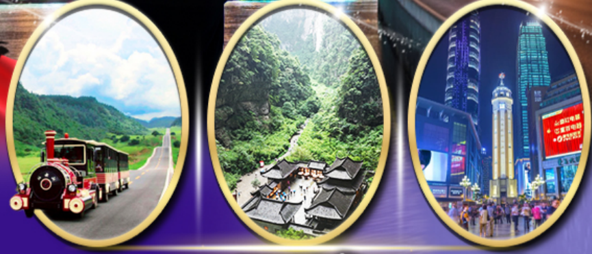
อุทยานเขานางฟ้า อุทยานหลุมฟ้า สะพานสวรรค์ ถนนคนเดินเจียฟางเป็ย

รหัสทัวร์ RJ-CZCKG01 เดินทาง 5D 3N ท.ค. - ต.ค. 2569