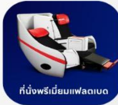
ที่นั่งพรีเมียมแพลนเบด