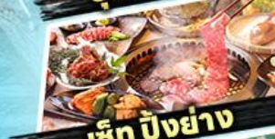
เซ็ท บิงย่าง