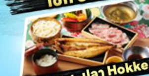
เซ็ทซาซุ + ปลา Hokke