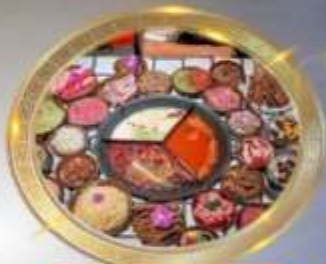
บุฟเฟต์หน็อไฟฉงชิ่ง

ชมรถไฟทะลุถ้ำ จตุรัสศาลาประชาชน หงหยาดัง วัดหลิวอัน ซุปบึงหางหูฉงชิ่ง หมู่บ้านฉือจิวโค่ว ถนนเจี่ยฟางเป่ย์