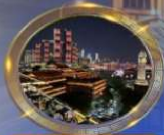
ตึกท่าเรืออาหารรสหนักลิ้น