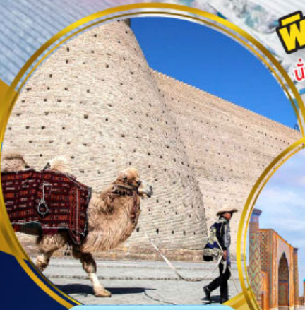
บ้อมปราการบุการ์่า