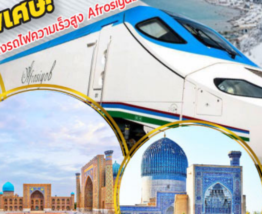
จัตุรัสเรจิสถาน