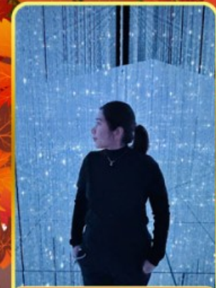
ทีมแอปโตเกียว

ออนเซ็น 2 คั้น นน.กระเป๋า 23 กก.X2 8Days 5Night