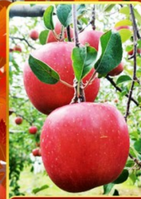
กิจกรรมเก็บแอปเปิ้ล