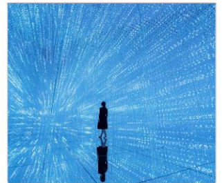
ทีมเล็บแพคเน็ต