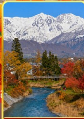
โออิเดะพาร์ค