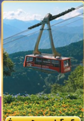
นั่งกระเช้าชูชิวาโคเออิน