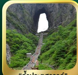
"กำแพงประตูสวรรค์"