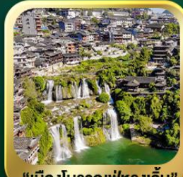
"เมืองโบราณฟูหรงเจิ้น"