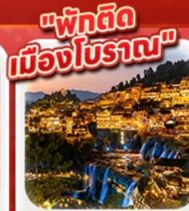
“เมืองโบราณฟู่หลงเจิน”