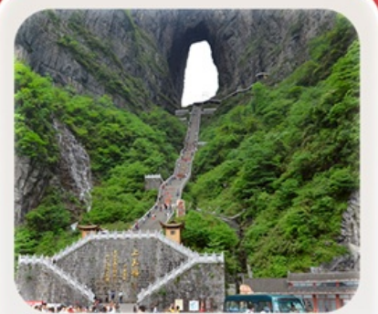
“กำประตูลิ่วหวง”