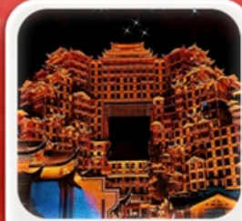
“ตึกมหัศจรรย์ 72 ชั้น”