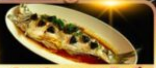
ปลาประรานาริบดี