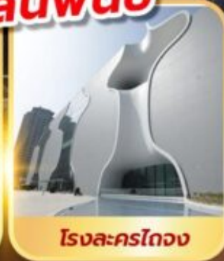
โรงแรมเดอะไฮลิ้ง