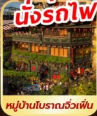
หมู่บ้านโบราณฉิวเฟิน