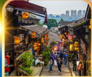
หมู่บ้านโบราณฉือชี่โจว