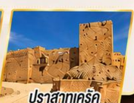
ปราสาทแคร็ก