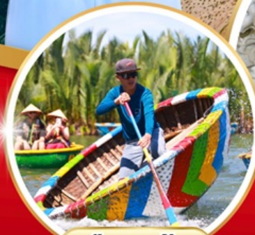
เรือกระด้าง