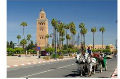
นั่งรถม้าชมเมือง

** พักที่ Adam Park Hotel 5* หรือเทียบเท่า **