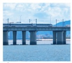
นั่งรถไฟใต้ดินข้ามทะเล