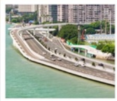
สะพานเหยียนหวู่เจียว

1 ประเทศ 2 ระบบ ในทริปเดียว!! ข้ามทะเลจากจีน...สู่จินเหมิน (ไต้หวัน)