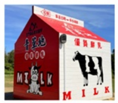
ฟาร์มโคนมจินเหมิน