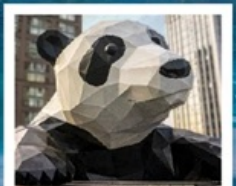
ห้าง IFS แพนด้าป็นตึก

จัดทริปหย่างเกี้ยนวู / รูปปั้นหมีแพนด้าเซลฟี / เมืองโบราณกัวนเซี่ยน คำธารสีฟ้า / อุทยานภูเขาสี่ดรุณี / อุทยานชวงเฉียวโกว (รวมรถอุทยาน) อุทยานπίเฉงโกว (รวมรถอุทยาน + รถแบตเตอรี่) / อุทยานจิวจ้ายโกว (รวมรถเหมา) ถนนคนเดินซุนชี่ลู่ / ห้าง IFS แพนด้าป็นตึก / ถนนคนเดินไท่กู่หลี่ ถนนคนเดินชอยกว้างแคว (POP MART)