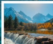
อุทยานπίเฉงโกว